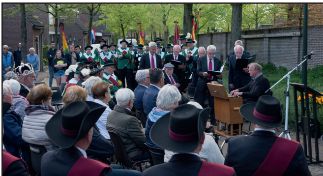
Koor en Gilden bij de Dodenherdenking 2023.