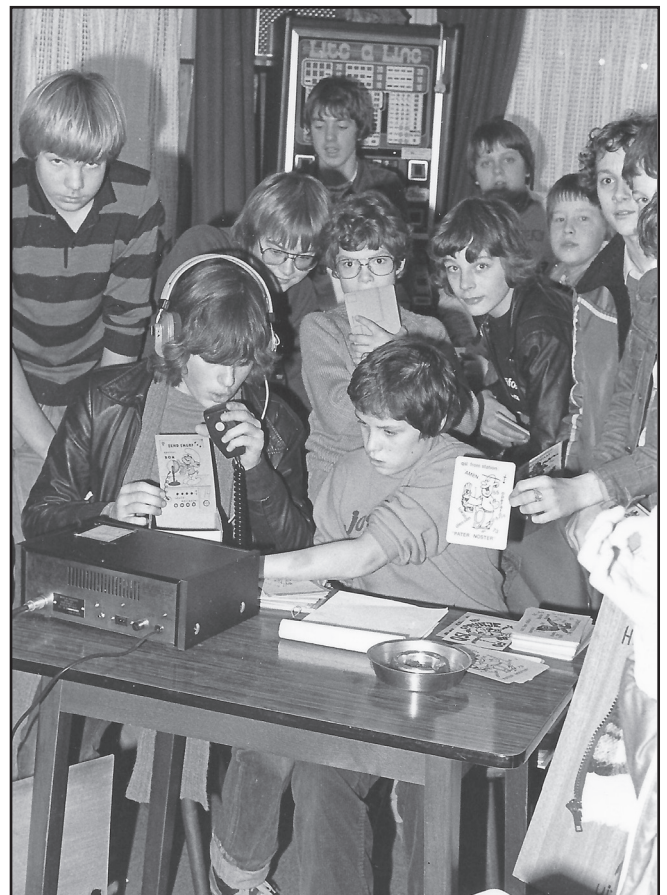
De duizendste foto van Diessens Foto-album.