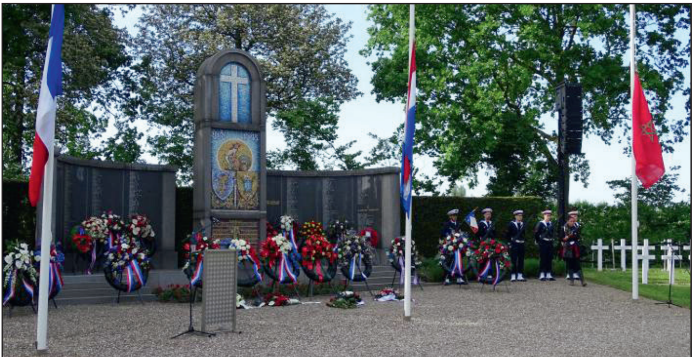
Het monument op de Franse Erebegraafplaats in Kapelle. De 7 'Diessense' Fransen liggen in de achterste rij direct links van het monument. Zie foto boven.

Op de Franse Erebegraafplaats in Kapelle rusten onder meer 7 van de 11 militairen die op 12 mei 1940 in Diessen zijn gesneuveld. Helaas konden in 1949 slechts 4 van de 11 geïdentificeerd worden; zij zijn gerepatrieerd naar Frankrijk en aldaar begraven. De overige 7 zijn in Kapelle herbegraven als onbekende soldaat, op hun grafkruis staat Français non-identifié . Onze vrienden van Memorial zijn naar aanleiding van de 12 mei 1940-brug gestart met naspeuringen die moeten leiden tot identificatie van het 'Diessense' zevental. Hiertoe sporen ze – met ongekende vasthoudendheid – op alle denkbare manieren nabestaanden van de gesneuvelden op, zodat deze dna kunnen afstaan. Mogelijk zijn de resultaten daarvan al in mei 2024 bekend en kunnen de 7 grafkruizen alsnog van de juiste naam worden voorzien. Wordt vervolgd.