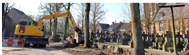
De kerkhofmuur gesloopt in maart 2025.