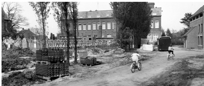
De kerkhofmuur geplaatst in mei 1981. (Zie Diessens fotoalbum nr. 1207).

Vierenveertig jaar geleden werd een nieuwe kerkhofmuur geplaatst. Vanwege een slechte bouwkundige staat moest er iets mee gebeuren. De muur had geen monumentale status en was ook niet fraai. De muur werd gesloopt en in het kader van vergroening werd een beukenhaag geplaatst. De muur waarop het oorlogsmonument is bevestigd is wel blijven staan.