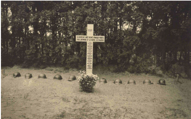
Graf van de Franse gesneuvelde militairen.

In de periode september 2024-mei 2025 herdenken we op diverse momenten het einde van de Tweede Wereldoorlog. We vieren dat we al 80 jaar in vrijheid mogen leven. Daarnaast willen we in mei 2025 ook stilstaan bij het begin van de Tweede Wereldoorlog, 85 jaar geleden.